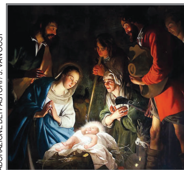
ADORAZIONE DEI PASTORI / J. VAN OOST